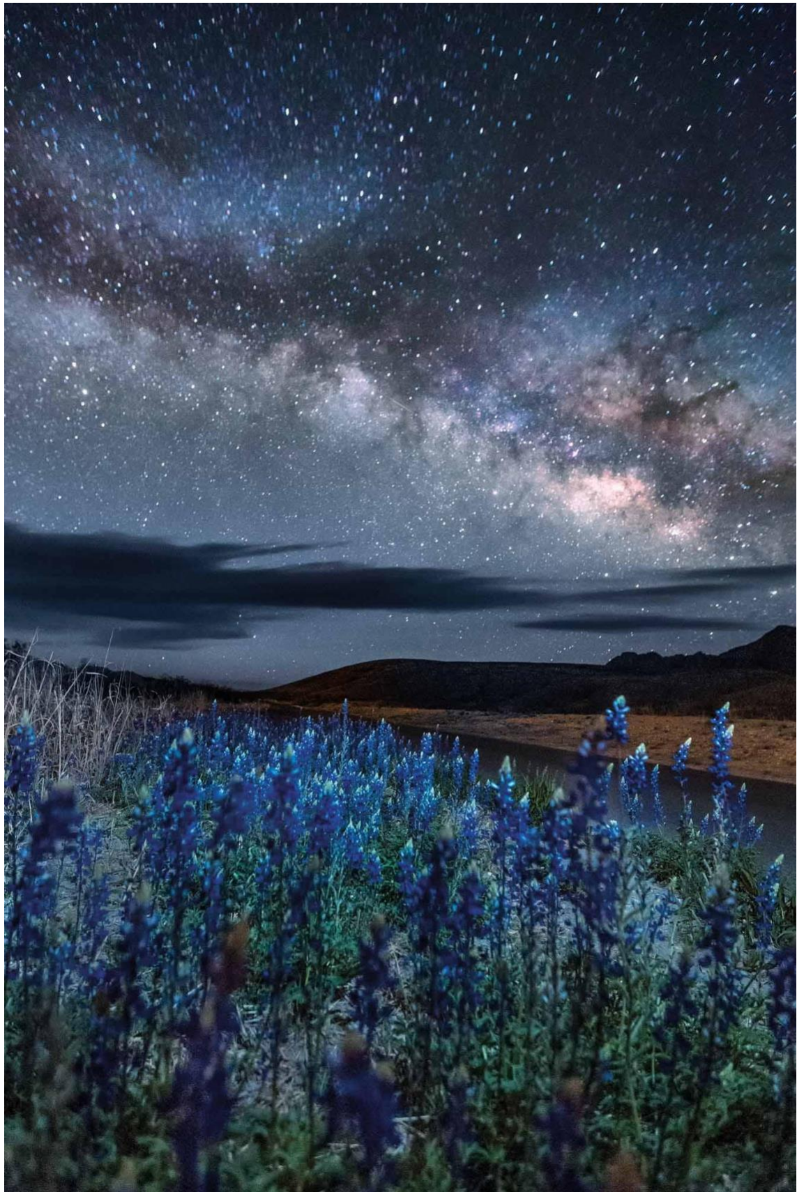
Bluebonnets en Terlingua